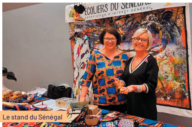
Le stand du Sénégal

Tout au long de la soirée, le stand « Écoliers du Sénégal » proposait à la vente des articles représentatifs du Sénégal.