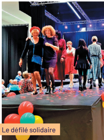
Le défilé solidaire