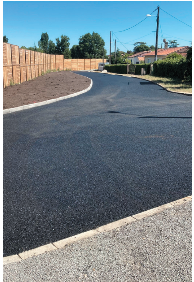
> TRAVAUX COQUELICOTS

Encore un maillage mobilité douce réalisé pour nos concitoyens.