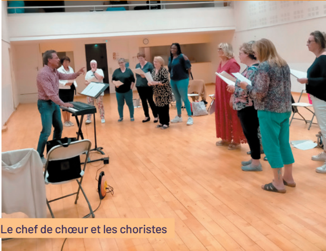
Le chef de chœur et les choristes

Site Web : ecoledesarts-fsh.com Mail : ecoledesarts.fsh@gmail.com Tél : 07 83 20 56 65