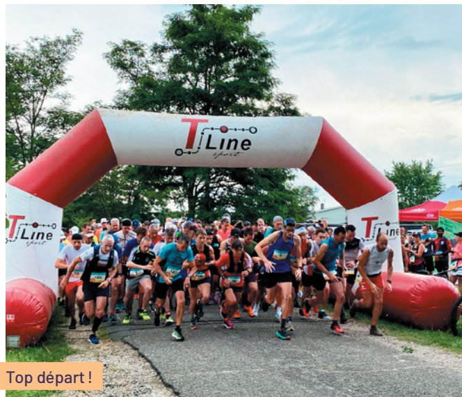
Top départ !

L'ambiance toujours présente a perduré le samedi 11 juin