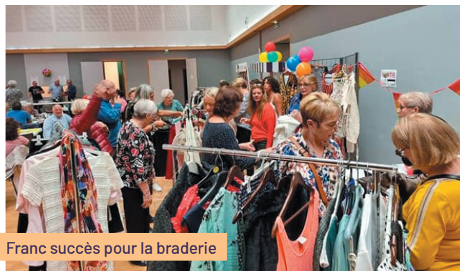
Franc succès pour la braderie