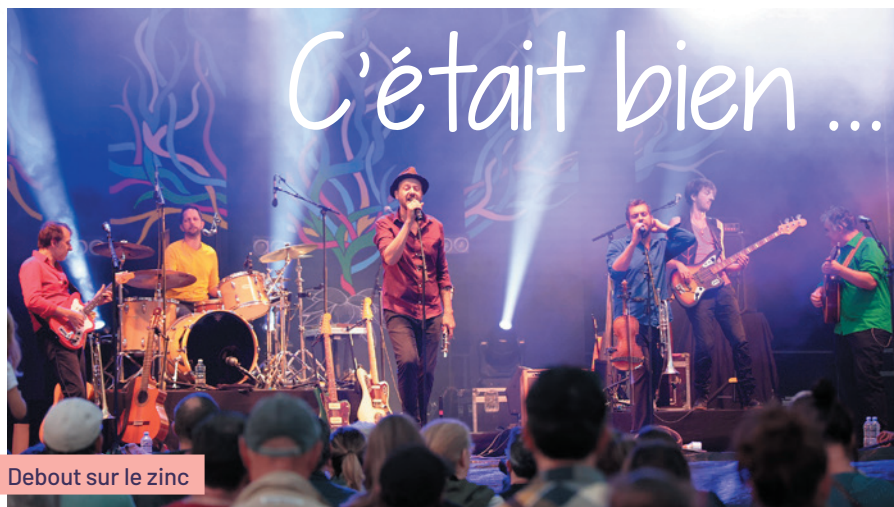
Debout sur le zinc

Sur ce dernier point, nous les remercions chaleureusement ainsi que tous les acteurs qui nous ont soutenus !