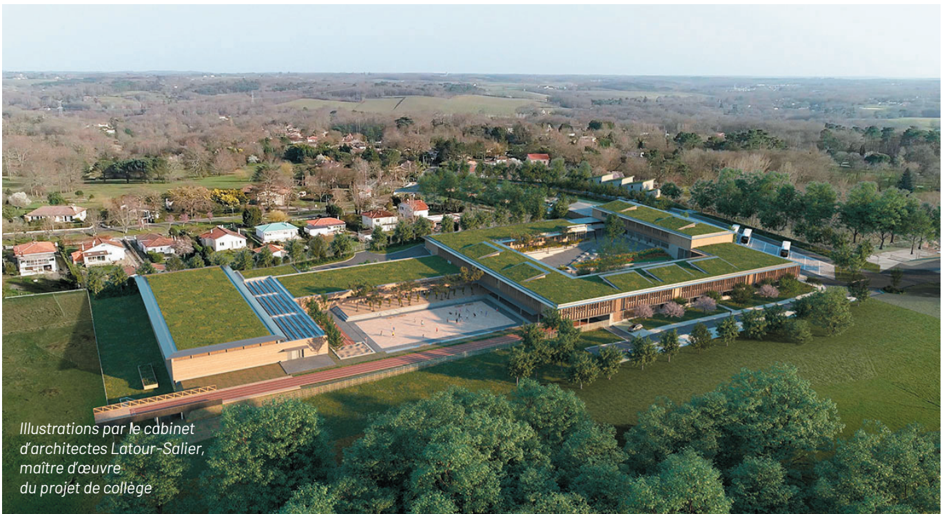
Illustrations par le cabinet d'architectes Latour-Salier, maître d'œuvre du projet de collège

Le Conseil Municipal pourra prononcer l'approbation de ce projet après y avoir apporté d'éventuelles modifications en tenant compte des avis reçus (CDPENAF, MRAe, PPA...), des observations du public, du rapport et des conclusions du Commissaire-enquêteur.