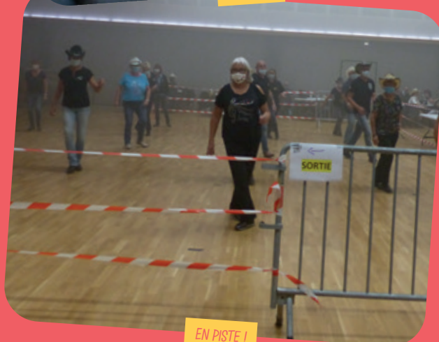
EN PISTE !