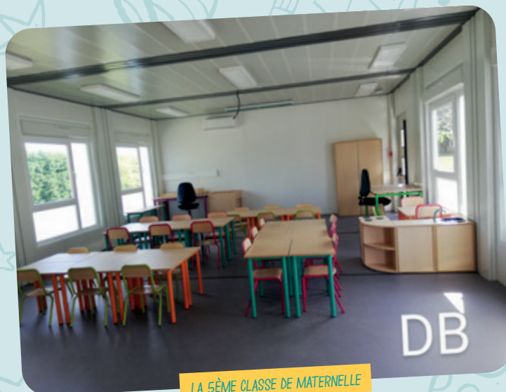
LA 5 ème CLASSE DE MATERNELLE

L'enjeu sur cette mandature est d'apporter un nouvel environnement pour conserver et poursuivre l'évolution de la qualité éducative et de service à nos enfants."